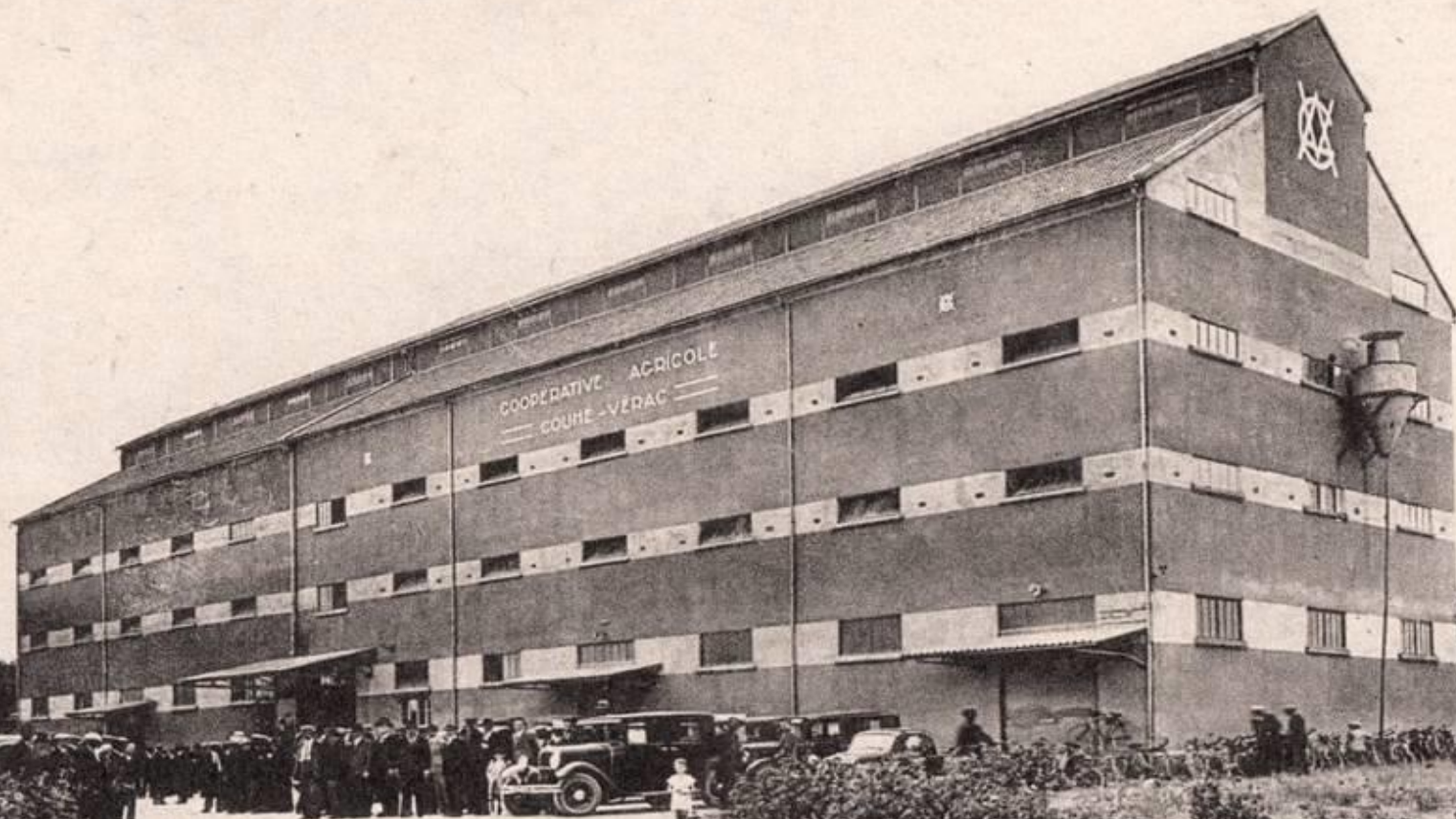
Coopérative Agricole .. COUHÉ-VÉRAC (Vienne)