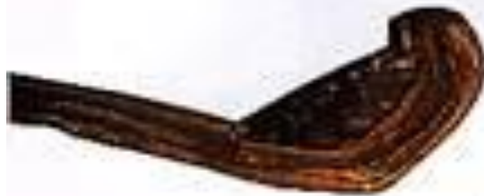
Une faucille à lame de pierre